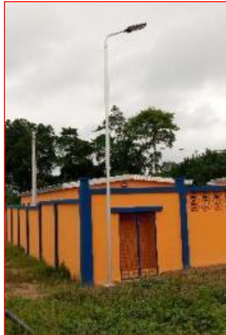
Lampadaire solaire et niche CIE